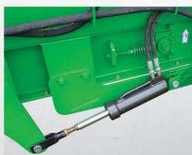
Sistema hidráulico elevación de batea de descarga

La descarga es realizada con un transportador lateral a cadenas accionado a través de un motor hidráulico de velocidad variable, imprescindible para una distribución controlada. También la altura del acarreador es regulable hidráulicamente para un racionamiento constante y uniforme.